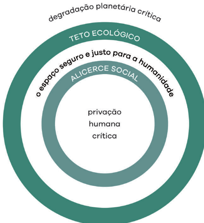
Figura 1.0 A essência do Donut: um alicerce social de bem-estar abaixo do qual ninguém deve cair e um teto ecológico de pressão planetária que não devemos transpor. Entre os dois encontra-se o espaço seguro e justo para todos.

Ao desenhar suas metas, ela chegou a uma curiosa forma de rosquinha ou donut – um par de anéis concêntricos, com o alicerce social dentro do anel interno e o teto ecológico representado pelo anel externo.